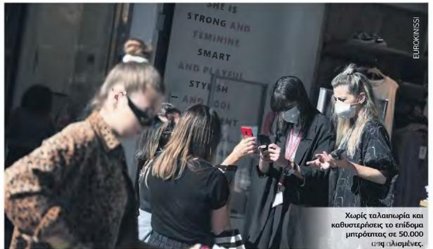
Χωρίς ταλαιπωρία και καθυστερήσεις το επίδομα μητρότητας σε 50.000 ασφαλισμένες.