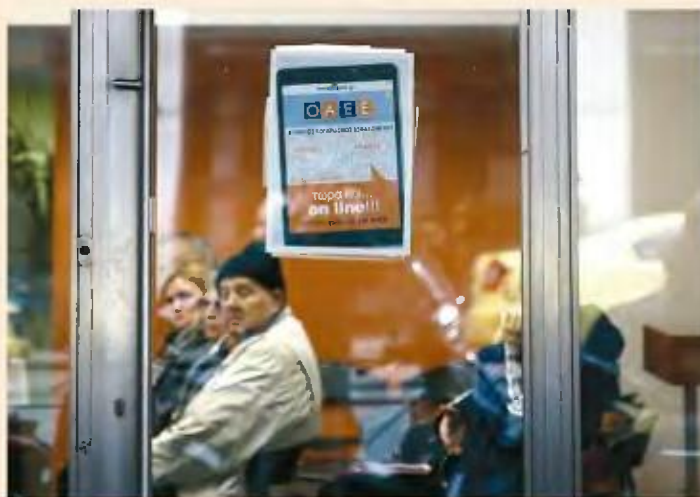
Σε πρώτη φάση οι πιστοποιημένοι ιδιώτες μπορούν να αναλάβουν νέες συνταξιοδοτικές υποθέσεις των τ. ΙΚΑ, τ. ΟΓΑ και τ. ΟΑΕΕ.

Από την ερχόμενη Δευτέρα 15 Νοεμβρίου, οι 179 πιστοποιημένοι λογιστές και δικηγόροι θα μπορούν να επιλέγονται από τους ασφαλισμένους για να αναλάβουν την έκ-