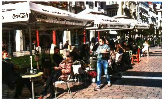
Ανάλογα με την εξέλιξη των οικονομικών μεγεθών, θα εξεταστεί αν το 5% θα αποτελέσει σωρευτική αύξηση (δηλαδή 2%+3%) το πρώτο και το δεύτερο εξάμηνο του 2022 αντίστοιχα ή αν ο κατώτατος μισθός μετά το καλοκαίρι θα αυξηθεί συνολικά πάνω από 5%.

Ενδεικτικά αναφέρουμε ότι το ποσοστό αύξησης του κατώτατου μισθού στην Πολωνία ανήλθε σε 7,7%, το οποίο αντιστοιχεί σε μόλις 1,16 ευρώ. Η αύξηση 4,6% της Κροατίας αντιστοιχεί σε 1,08 ευρώ, ενώ η αύξηση-μαμούθ 16,3% της Λετονίας από την 1η Ιανουαρίου του 2021 αντιστοιχεί σε μόλις 0,41 ευρώ λαμβάνοντας υπ' όψιν ότι οι μισθοί στις πρώην ανατολικές χώρες είναι εξαιρετικά χαμηλοί. Ωστόσο, σύμφωνα με την ανάλυση του υπουργείου Εργασίας, δεν μπορεί να υπάρξει σύγκριση των ονομαστικών αυξήσεων, καθώς διαφέρουν σημαντικά τα νομισματικά και οικονομικά μεγέθη (πληθωρισμός, συναλλαγματική ισοτιμία, μεταβολή ΑΕΠ, ιστορικό μεταβολών κατώτατου μισθού).