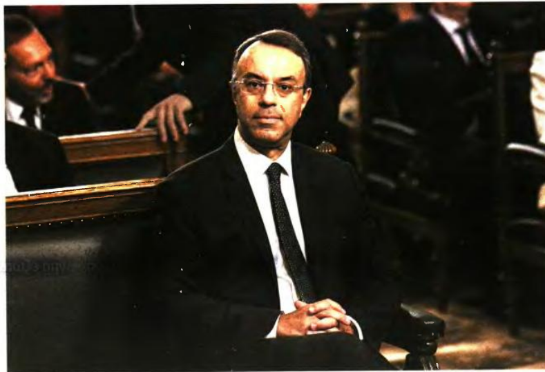
Πυρετός διαβουλεύσεων του ΥΠΟΙΚ με τους θεσμούς για τη διανομή ενός έκτακτου βοηθήματος σε οικονομικά ευάλωτα νοικοκυριά.

Το πρόβλημα που υπάρχει είναι ότι, ενώ αρκετά στοιχεία προμηνύουν μεγαλύτερη ανάπτυξη, δεν είναι ακόμη «επισημασμένα». Κατά τη 12η αξιολόγηση, η ελληνική πλευρά παρουσιάζει τα στοιχεία που αποδεικνύουν ότι ο ρυθμός ανάπτυξης της οικονομίας είναι σημαντικά μεγαλύτερος από 6%. Συγκεκριμένα, δόθηκαν στοιχεία σύμφωνα με τα οποία οι εισπράξεις από τον τουρισμό θα αυξηθούν και τον Νοέμβριο, βελτιώνοντας και το 4ο τρίμηνο του χρόνου, αναφέρθηκε η