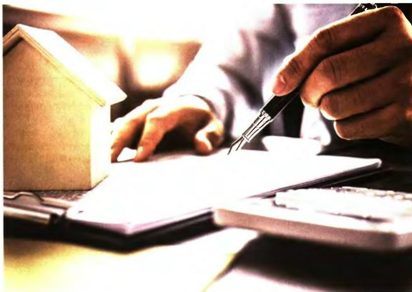
Οι μεταβιβάσεις καταγράφουν αύξηση της τάξης του 25% σε σύγκριση με το αντίστοιχο περυσινό διάστημα και όλα δείχνουν ότι τόσο τον τρέχοντα μήνα όσο και τον επόμενο θα καταγράφουν περαιτέρω αύξηση.

Οπόσο, το αφορολόγητο αυτό ποσό μπορεί να επεκταθεί και στη δεύτερη κατηγορία, στην οποία υπάγονται τα αδέρφια. Δηλαδή μπορεί να γίνει μέσω τριγωνικής συναλλαγής η διάθεση χρηματικού ποσού έως 800.000 ευρώ αφορολόγητα. Αυτό γίνεται ως εξής: Το παιδί δωρίζει στον πατέρα του 100.000 ευρώ , ποσό το οποίο