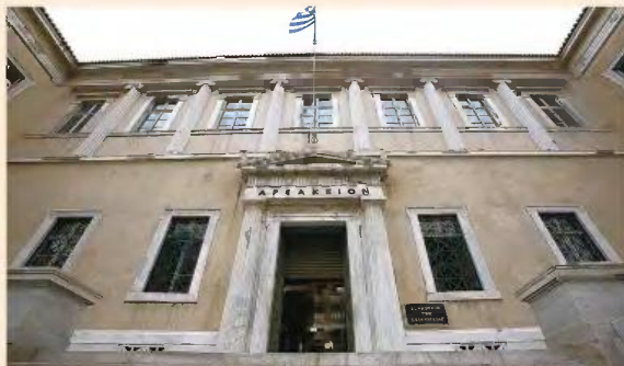
Η Ολομέλεια του ΣτΕ αποφάσισε κατά πλειοψηφία υπέρ της αντισυνταγματικότητας της διάταξης, με το σκεπτικό ότι το επίμαχο άρθρο 95 του νόμου του 2016 «αντίκειται στην αρχή της αναλογικότητας».

Αντίθετα, η μειοψηφία εξέφρασε την άποψη ότι η 20ετής γενική παραγραφή, που θεσπίζεται με το άρθρο 95 του ν. 4387/2016, δεν αντίκειται σε καμία συνταγματική ή υπερνομοθετική ισχύος διάταξη και αρχή.