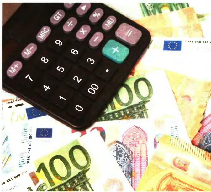
Το σύνολο των καθαρών ληξιπρόθεσμων χρεών του Δημοσίου ανέρχεται σε 960 εκατ. ευρώ, εκ των οποίων τα 420 εκατ. αφορούν συντάξεις και εφάπαξ και τα υπόλοιπα 540 εκατ. χρέη νοσοκομείων, ΕΦΚΑ, ΟΤΑ κ.λπ.

Η έκθεση της Κομισιόν για τη 12η αξιολόγηση αναμένεται στις 24 Νοεμβρίου και η συζήτηση της στο Eurogroup, όπου και θα αποφασιστεί η εκταμίευση της δόσης των 750 εκατ. ευρώ, θα γίνει στις 6 Δεκεμβρίου.