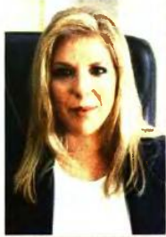
Η υφυπουργός Εργασίας και Κοινωνικών Υποθέσεων, αρμόδια για τη δημογραφική πολιτική, Μαρία Συρεγγέλα

Με δεδομένο ότι το σχέδιο θα είναι συνεκτικό, περιλαμβάνοντας όλα τα μέτρα, αναμένεται σε αυτό να ενταχθούν και προσαρτάς ψηφισθέντα μέτρα τα οποία ήδη έχουν θετική επίδραση, όπως η πατρική άδεια 14 ημερών μετά τη γέννα, αλλά και το πρόγραμμα «Νταντάδες της γειτονιάς», το οποίο σε πρώτο στάδιο θα καλύψει περιοχές στις οποίες δεν υπάρχουν βρεφονηπιακό σταθμό.