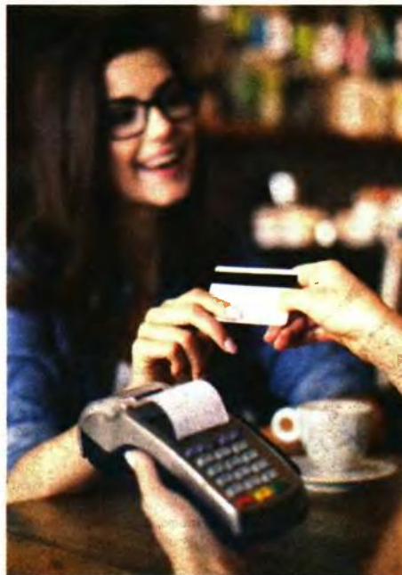
Η υποχρέωση κάλυψης ποσοστού 30% του ετήσιου πραγματικού εισοδήματος με ηλεκτρονικές πληρωμές δαπανών (μέσω πιστωτικών ή κρεωστικών ή προπληρωμένων καρτών ή μέσω e-banking) νομοθετήθηκε το 2019.

3 Από την υποχρέωση να έχουν καλύψει το ποσοστό 30% του ετήσιου πραγματικού εισοδήματος με δαπάνες για αγορές αγαθών και παροχή υπηρεσιών εξοφληθείσες με ηλεκτρονικά μέσα πληρωμής εξαιρούνται όσοι φορολογούμενοι θα έχουν πραγματοποιήσει εντός του 2021 δαπάνες για πληρωμές φόρου εισοδήματος φυ-