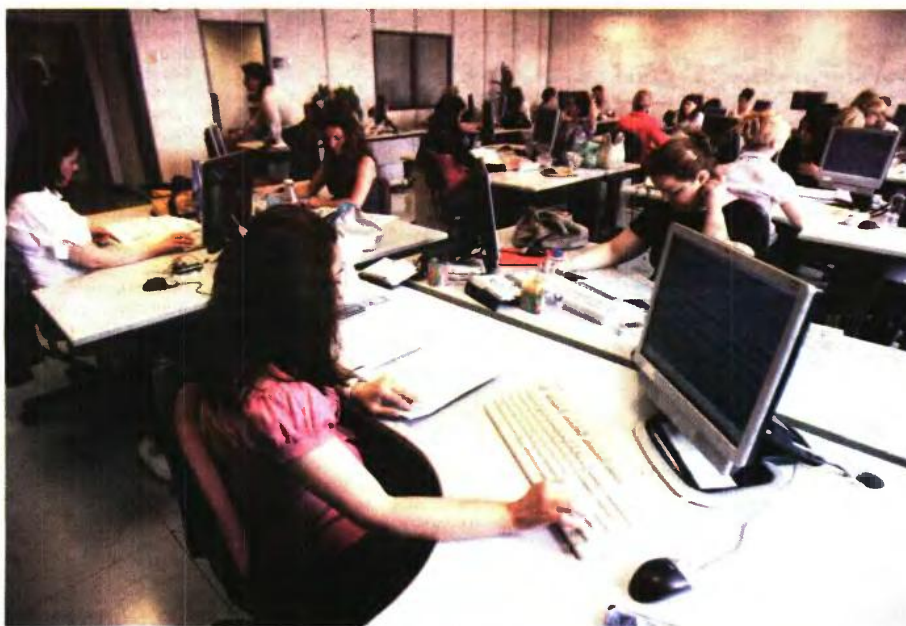
Το επτάμηνο Ιανουαρίου - Ιουλίου 2021 εκδικάστηκαν από τη Διεύθυνση Επίλυσης Διαφορών της ΑΑΔΕ 3.772 προσφυγές, από τις οποίες έγιναν αποδεκτές, εν όλω ή εν μέρει, οι 1.470, δηλαδή το 39%.

Το ποσοστό των φορολογουμένων που δικαιώθηκαν μερικώς ή ολικώς από τη ΔΕΔ είναι φέτος μέχρι στιγμής το υψηλότερο σε σύγκριση με τα πο-