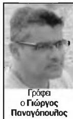
Γράφει ο Γιώργος Παναγόπουλος

Το δημογραφικό δεν είναι βεβαίως μόνο τοπικό πρόβλημα, αλλά εθνικό. Να σημειωθεί ότι από το 2011 μέχρι το 2020 ο πληθυσμός της χώρας μειώθηκε κατά 405.000 άτομα. Στην απογραφή που