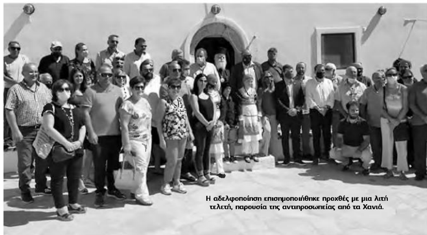
Η αδελφοποίηση επιστημοποιήθηκε προχθές με μια λιτή τελετή, παρουσία της αντιπροσωπείας από τα Χανιά.