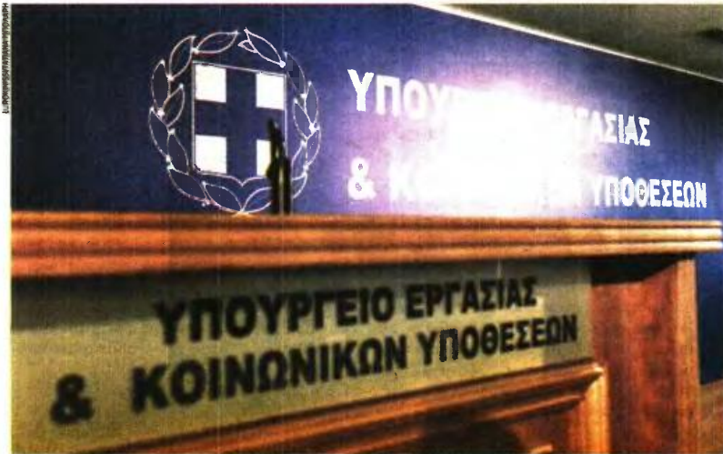
Με τις μεταρρυθμίσεις του υπ. Εργασίας στο σύστημα επικούρησης, από το 2022 οι εισφορές των νεοεισερχόμενων στην αγορά εργασίας θα επενδύονται μέσω κεφαλαιοποιτικού συστήματος.

2 ΤΕΚΑ: Το Ταμείο Επικουρικής Κεφαλαιοποιτικής Ασφάλισης θα είναι ένα νομικό πρόσωπο δημοσίου δικαίου, που θα αναλαμβάνει την υποχρέωση της επένδυσης των κεφαλαίων που θα συσσωρεύονται στους ατομικούς λογαριασμούς που θα έχει στη διάθεσή του. Το ΤΕΚΑ θα έχει αυτόνομη διοίκηση, η οποία όμως θα λογοδοτεί στο υπουργείο Ερ-