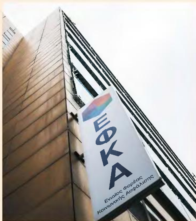
Το σύνολο των εισφορών διατηρείται στο 36,66% από 39,66%.

Να σημειωθεί ότι το σχέδιο του οικονομικού επιτελείου της κυβέρνησης, πριν από την εμφάνιση της πανδημίας του κορωνοϊού, προέβλεπε σωρευτική μείωση της τάξης των 5 ποσοστιαίων μονάδων, ώστε οι εισφορές να φτάσουν στο 35,56% μέχρι το 2023. Εφόσον κάτι τέτοιο ισχύσει, θα διατηρηθεί ως μόνιμη η μείωση των 3 μονάδων που με την τροπολογία παρατείνεται έως το 2022