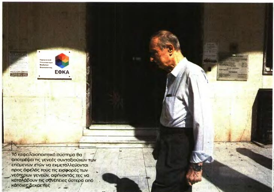
Το κεφαλαιοποιητικό σύστημα θα απορροφή τις γενεές συνταξιούχων των επόμενων ετών να εκμεταλλεύονται προς όφελός τους τις εισφορές των νεότερων γενεών, αφήνοντάς τες να καταβάλουν τις συνέπειες ύστερα από κάποιες δεκαετίες