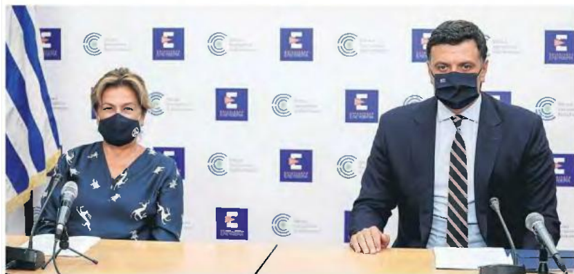
Ο αριθμός των ασθενών που νοσηλεύονται με μηχανική υποστήριξη της αναπνοής τους αυξάνεται ημέρα με την ημέρα και η περαιτέρω άνοδος των κρουσμάτων απειλεί ξανά το ΕΣΥ με μεγάλη πίεση.

Ο,τι προβλέπει ο νόμος Όσον αφορά στα πολυάριθμα, για τους ανεμβολίαστους εργαζομένους ισχύει ό,τι προβλέπει ο νόμος περί υποχρεωτικότητας. Εάν οι μη εμβολιασμένοι δεν έχουν κάνει την πρώτη ή μοναδική δόση έως την 1η Σεπτεμβρίου, τότε ο εργοδότης μπορεί να τους θέσει σε αναστο-