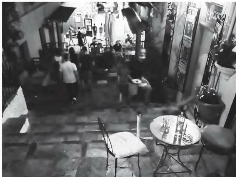
Σύμφωνα με τους εστιατόρες, τα προβλήματα που δημιουργούνται είναι τεράστια και θέτουν σε κίνδυνο τη βιωσιμότητα εκατοντάδων επιχειρήσεων.

Η νέα τιμή για το ταχύ αντιγονικό τεστ ορίζεται στα 10 ευρώ σε σχέση με 20 ευρώ που ισχύει έως σήμερα, βρίσκοντας αντίθετους εκπροσώπους εργασπειρίων