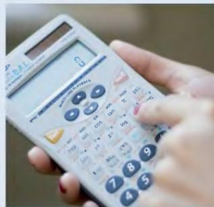
ΠΟΣΟ ΚΟΣΤΙΖΟΥΝ ΤΑ ΠΛΑΣΜΑΤΙΚΑ ΕΤΗ ΓΙΑ ΓΡΗΓΟΡΗ ΕΞΟΔΟ ΣΤΗ ΣΥΝΤΑΞΗ

Στις περιπτώσεις που κατά το ίδιο έτος έχουν υποβληθεί περισσότερες από μία αιτήσεις αναγνώρισης χρόνου με εξαγορά, η μηνιαία εισφορά θα πρέπει να υπολογιστεί με την εισφορά της πρώτης αίτησης. Για την παράλληλη ασφάλιση με μισθωτή και μη μισθωτή δραστηριότητα, οι οδηγίες για τις αναγνωρίσεις ετοιμάζονται αλλά σύμφωνα με πληροφορίες και εδώ θα γίνονται με βάση το ελάχιστο ποσό των 155 ευρώ το μήνα.