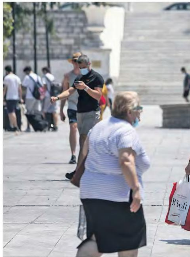
ΟΙ ΑΥΞΗΣΕΙΣ Κ

Το πρόβλημα αφορά τους συνταξιούχους των Ταμείων του ιδιωτικού τομέα, που προέρχονται δηλαδή από το ΙΚΑ, από τα Ειδικά Ταμεία (ΔΕΚΟ, τραπεζών ΕΤΑΠ-ΜΜΕ), τον ΟΑΕΕ, το ΝΑΤ, το ΕΤΑΑ. Αντίθετα το Δημόσιο, μέσα από το δικό του μηχανογραφικό σύστημα (το ΕΣΕΠΣ), προσαρμόσε ήδη από τον Φεβρουάριο του 2021 τον υπολογισμό των συντάξεων στα ποσοστά αναπλήρωσης του νόμου 4670 για αιτήσεις από 1ης/10/2019 και μετά και για όσους αιτήσεις που εκδίδει είναι απευθείας με το νόμο Βρούτση και με αυξημένα ποσά συντάξεων χωρίς να χρειάζεται επανυπολογισμός. ■