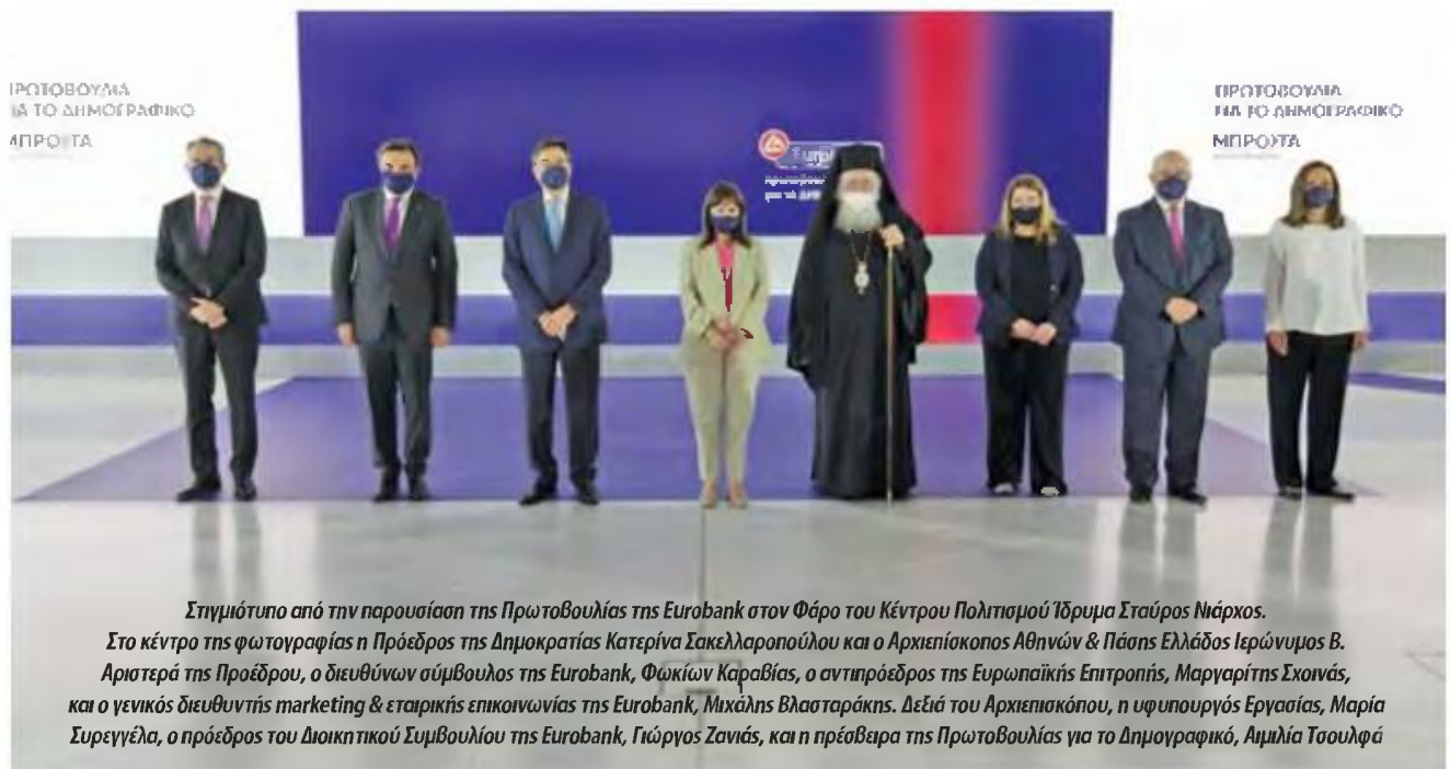
Στιγμιότυπο από την παρουσίαση της Πρωτοβουλίας της Eurobank στον Φάρο του Κέντρου Πολιτισμού Ίδρυμα Σταύρος Νιάρχος. Στο κέντρο της φωτογραφίας η Πρόεδρος της Δημοκρατίας Κατερίνα Σακελλαροπούλου και ο Αρχιεπίσκοπος Αθηνών & Πάσης Ελλάδας Ιερώνυμος Β. Αριστερά της Προέδρου, ο διευθύνων σύμβουλος της Eurobank, Φωκίων Καραβίας, ο αντιπρόεδρος της Ευρωπαϊκής Επιτροπής, Μαργαρίτης Σχοινιάς, και ο γενικός διευθυντής marketing & εταιρικής επικοινωνίας της Eurobank, Μιχάλης Βλασταράκης. Δεξιά του Αρχιεπισκόπου, η υφυπουργός Εργασίας, Μαρία Συρεγγέλα, ο πρόεδρος του Διοικητικού Συμβουλίου της Eurobank, Γιώργος Ζανιάς, και η πρόεδρος της Πρωτοβουλίας για το Δημογραφικό, Αιμιλία Τσουλιφά