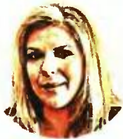
ΤΗΣ ΜΑΡΙΑΣ ΣΥΡΕΓΓΕΛΑ , ΥΦΥΠΟΥΡΓΟΥ ΕΡΓΑΣΙΑΣ ΚΑΙ ΚΟΙΝΩΝΙΚΩΝ ΥΠΟΘΕΣΕΩΝ, ΑΡΜΟΔΙΑΣ ΓΙΑ ΤΗ ΔΗΜΟΓΡΑΦΙΚΗ ΠΟΛΙΤΙΚΗ ΚΑΙ ΤΗΝ ΟΙΚΟΓΕΝΕΙΑ