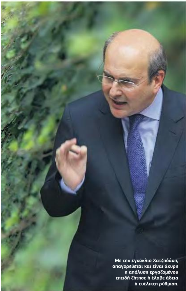
Με την εγκύκλιο Χατζηδάκη, απαγορεύεται και είναι άκυρη η απόλυση εργαζομένου επειδή ζήτησε ή έλαβε άδεια ή ευέλικτη ρύθμιση.

το επίδομα της γονικής άδειας και στους γονείς που έλαβαν την άδεια με βάση το προηγούμενο πλαίσιο (που δεν προέβλεπε επίδομα) εφόσον η άδεια αυτή δεν είχε λήξει στις 19 Ιουνίου 2021, ημερομηνία όπου τέθηκε σε ισχύ ο νέος νόμος.