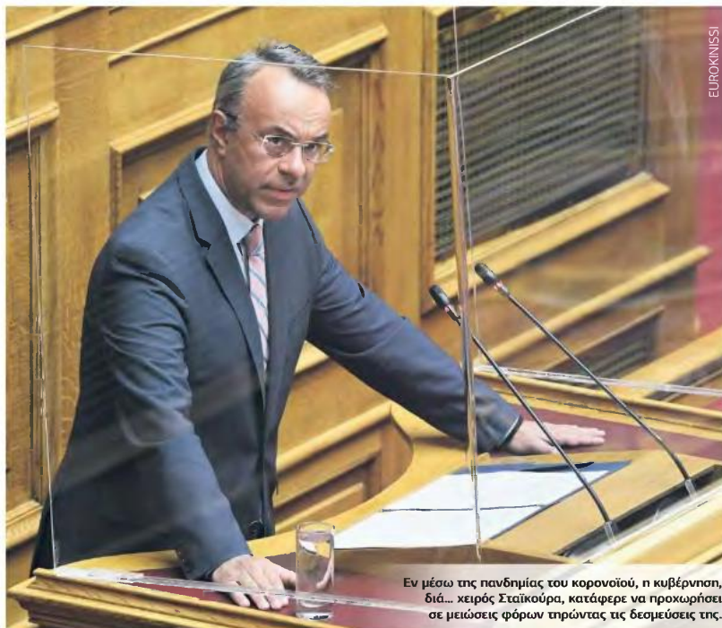
Εν μέσω της πανδημίας του κορονοϊού, η κυβέρνηση, διά... κειρός Σταϊκούρα, κατάφερε να προχωρήσει σε μειώσεις φόρων πρώτα τις δεσμεύσεις της.

καφέ και τα μη αλκοολούχα ποτά και στους κινηματογράφους (έως 30.09.2021).