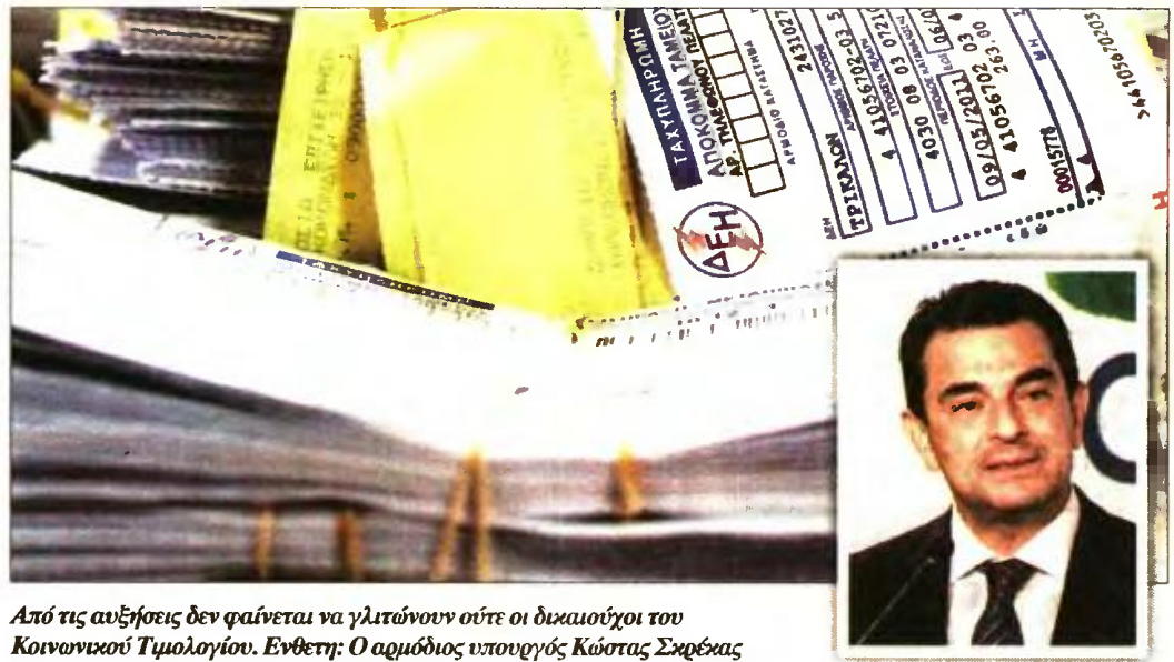
Από τις αυξήσεις δεν φαίνεται να γλιτώνουν ούτε οι δικαιούχοι του Κοινωνικού Τιμολογίου. Ενθετή: Ο αρμόδιος υπουργός Κώστας Σκρβέλιας

Σύμφωνα με την απόφαση της ΡΑΕ, οι νέες αυξημένες χρεώσεις διαμορφώνονται ως εξής: • Για τα οικιακά τιμολόγια χαμηλής τάσης αύξηση κατά 3,3%. Η χρέωση ηλεκτρικής ενέργειας φτάνει στο 0,56 ευρώ/KVh, από 0,542 ευρώ/KVh που ίσχυε το 2019 και το 2020. Αμετάβλητη παραμένει η χρέωση συμφωνημένης ισχύος παροχής ανά έτος, στο 0,13 ευρώ/KVA. • Για τα οικιακά τιμολόγια χαμηλής τάσης, δικαιούχους τους Κοινωνικού Τιμολογίου και πο- λυτέκνους αύξηση 3%. Η χρέωση υπολογίζεται σε 0,62 ευρώ/