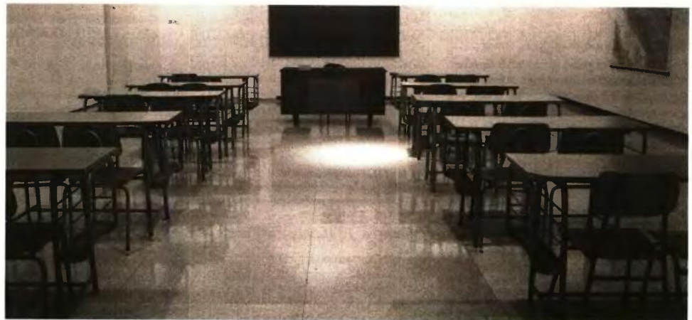
Σχολεία με μονοψήφιο αριθμό μαθητών λειτουργούν στην περιφέρεια της Μαγνησίας

Η πρόκληση από τη νέα σχολική χρονιά θα είναι η μείωση του μαθητικού δυναμικού. «Υπάρ-