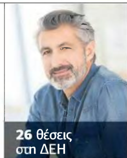
26 θέσεις στη ΔΕΗ

► Ο Δήμος Ναυπλίων ανακοινώνει την πρόσληψη 10 ΥΕ Εργατών Γενικών Καθκόντων με σύμβαση εργασίας ιδιωτικού δικαίου ορισμένου χρόνου, διάρκειας 3 μηνών. Η προθεσμία υποβολής των αιτήσεων ορίζεται σε επτά (7) ημέρες (υπολογιζόμενες ημερολογιακά) και αρχίζει από την επόμενη της τοκοκόλλησης της παρούσης στον πίνακα ανακοινώσεων του δημοτικού καταστήματος, ήτοι από 16/6/2021 έως και 22/6/2021.