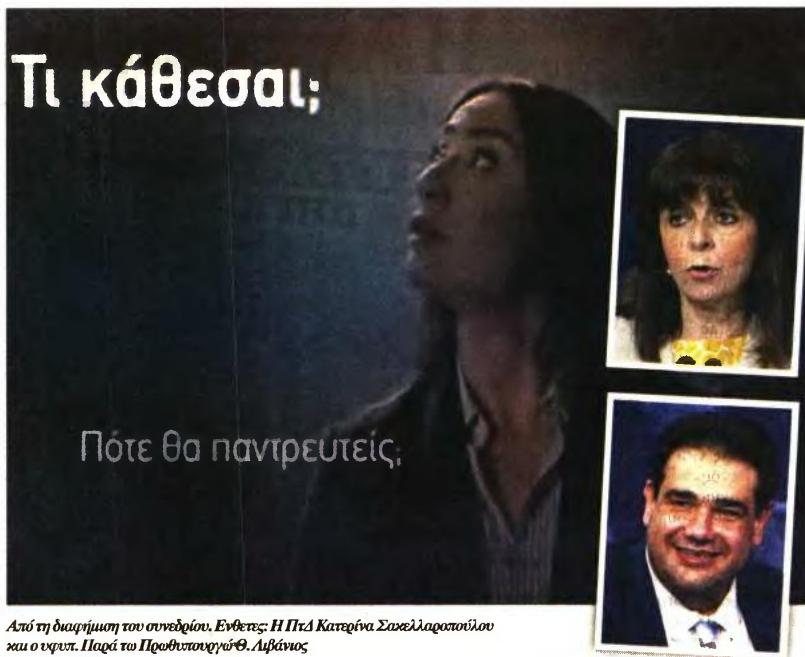
Από τη διαφήμιση του συνεδρίου. Ενθετός: Η ΠτΔ Κατερίνα Σακελλαροπούλου και ο υφυπ. Παρά το Πρωθυπουργό Θ. Λιβάνιος

ενώ είχαν συμφωνήσει και δεν είχαν πρόβλημα να συμμετάσχουν, με μια υποκριτική τους στάση ανακοίνωσαν ύστερα από τις ενστάσεις την αποχώρησή τους, χωρίς πάντως έως τώρα να έχουν καταθέσει συγκεκριμένες και ουσιαστικές προτάσεις για το Δημογραφικό. Η Πρόεδρος της Δημοκρατίας Κατερίνα Σακελλαροπούλου απέσυρε την αιγίδα της από το 1ο Πανελλήνιο Συνέδριο Γονιμότητας και Αναπαραγωγικής Αυτονομίας: Όρια και Επιλογές, ενώ, μέσω twitter, ο υφυπουργός Παρά το Πρωθυπουργό Θεόδωρος Λιβάνιος ανακοίνωσε ότι αποσύρονται η ΕΡΤ και το ΑΠΕ από τη χορηγία επικοινωνίας.