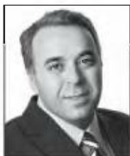
ΠΑΝΟΣ ΑΜΥΡΑΣ pamiras @e-typos.com

Τ ο ζήτημα της υπογονιμότητας είναι πολύ σοβαρό, η Ελλάδα αντιμετωπίζει το μεγαλύτερο δημογραφικό πρόβλημα στην Ευρώπη και ως εκ τούτου δεν προσφέρεται για επιδόλαιες προσεγγίσεις με αφορμή το τουλάχιστον «ατυχές» διαφημιστικό σποτ επιστημονικού συνεδρίου που προγραμματίζεται για τις επόμενες ημέρες.