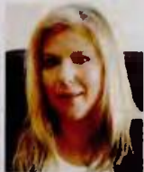
Της ΜΑΡΙΑΣ ΣΥΡΕΤΣΕΛΑ Υφυπουργού Εργασίας και Κοινωνικών Υποθέσεων, αρμόδιας για τη Δημογραφική Πολιτική και την Οικογένεια ●●●

Τ ο Δημογραφικό αποτελεί ένα από τα πιο ευαίσθητα και πολύπλοκα πολιτικά και κοινωνικά θέματα, το οποίο συνδέεται, διαπερνά και επηρεάζει μια σειρά άλλων τομέων κυβερνητικής πολιτικής, όπως είναι η εναρμόνιση της επαγγελματικής με την οικογενειακή ζωή και η ουσιαστική ισότητα των φύλων.