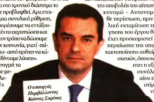
Ο υπουργός Περιβάλλοντος Κώστας Σκρέκας

Άδειες αλλαγής μόνο της χρήσης του κτηρίου ή άδειες ανακαινίσεως που δεν θίγουν τον φέροντα οργανισμό του κτηρίου δεν λαμβάνονται υπόψη για τον υπολογισμό της παλαιότητας, ενώ σε διατηρητέα ακίνητα που έχουν ανακαινιστεί ριζικά, έστω και αν δεν θίγεται ο φέρον οργανισμός του κτηρίου, η παλαιότητα υπολογίζεται δύο χρόνια μετά την ημερομηνία έκδοσης της άδειας ανακαινίσεως. Χρονικό διάστημα μικρότερο του εξαμηνιαίου δεν