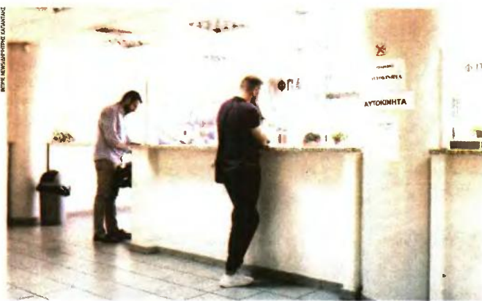
Βασική προϋπόθεση για τη δεύτερη ευκαιρία ευνοϊκής ρύθμισης αποτελεί να μην έχει απολεσθεί άλλη ρύθμιση τμηματικής καταβολής τα τελευταία δύο ημερολογιακά έτη πριν από την 1η.11.2019.

Αξίζει βέβαια να σημειωθεί ότι, για να έχουν τη δυνατότητα να υποχρεούνται να υποβάλουν την εν λόγω αίτηση δεύτερης ευκαιρίας για την ισχύουσα πάγια ρύθμιση θα πρέπει, σύμφωνα και με την υπ' αριθμ. Α.1127/4.6.2021 απόφαση του