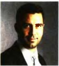
Γράφει ο Δημήτρης Μπούκας

δικηγόρος και διαπιστευμένος διαμεσολαβητής με ειδίκευση στις χρηματοοικονομικές και τραπεζικές διαφορές ( www.dboukas.gr , www.middle-point.gr )