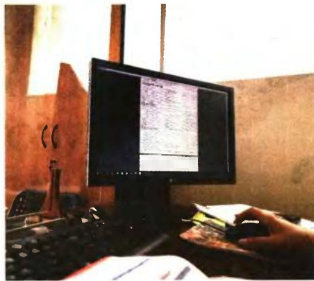
Η πλατφόρμα για την υποβολή των δηλώσεων φορολογίας των εισοδημάτων του 2020 έχει ήδη τεθεί σε λειτουργία από την Ανεξάρτητη Αρχή Δημοσίων Εσόδων (ΑΑΔΕ).

Οι 3 παραπάνω κατηγορίες μισθωτών φορολογουμένων θα φορολογηθούν φέτος αποκλειστικά με βάση τα πραγματικά εισοδήματα που απέκτησαν το 2020, έστω κι αν τα τεκμήρια διαβίωσης προσδιορίζουν σε υψηλότερο επίπεδο τα φορολογητέα εισοδήματά τους, εφόσον πληρούνται οι παρακάτω 3 προϋποθέσεις: