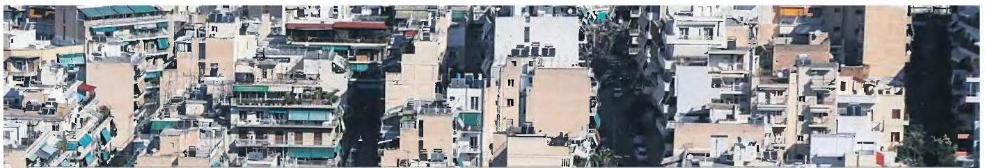
ΠΟΣΟ ΘΑ ΜΕΙΩΘΟΥΝ ΟΙ ΦΟΡΟΙ ΠΟΥ ΘΑ ΠΛΗΡΩΣΟΥΝ ΟΙ ΙΔΙΟΚΤΗΤΕΣ ΤΟ 2021