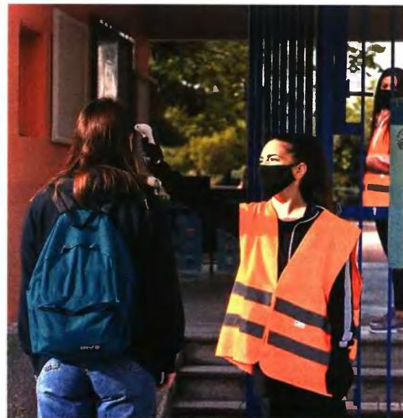
Θερμομέτρηση μαθητών πριν την είσοδο στο σχολείο

Συγκεκριμένα, οι εκπαιδευτικοί που υπηρετούν στις σχολικές μονάδες θα αξιολογούνται μεταξύ άλλων με κριτήρια: