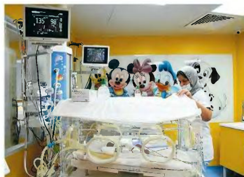
Νεογέννητο σε μαιευτήριο στην Καζαμπλάνκα, στο Μαρόκο. Ορισμέ-

Οι μεταβολές αυτές θα απαιτήσουν δεκαετίες. Η τάση, όμως, θεωρείται αναπόφευκτη, ενώ ο ρυθμός της είναι αυξητικός. Ειδικά στην Ανατολική Ευρώπη και στην Ασία η «δημογραφική ωρολογιακή βόμβα» έχει ήδη εκραγεί.