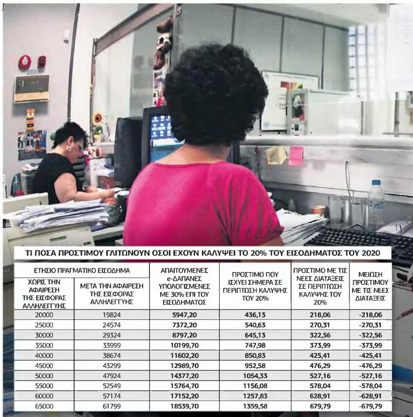
ΤΙ ΠΟΣΑ ΠΡΟΣΤΙΜΟΥ ΓΛΙΤΝΟΥΝ ΟΣΟΙ ΕΧΟΥΝ ΚΑΛΥΨΕΙ ΤΟ 20% ΤΟΥ ΕΙΣΟΔΗΜΑΤΟΣ ΤΟΥ 2020