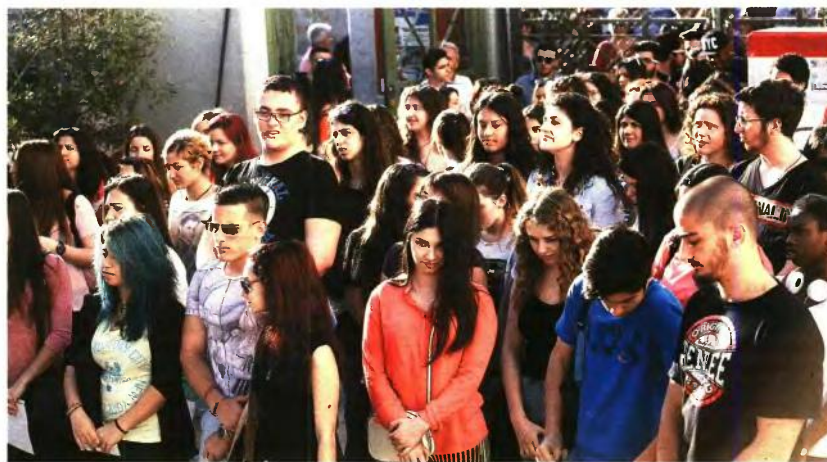
Με SMS στο κινητό τηλέφωνο των υποψηφίων θα στέλνονται τα αποτελέσματα των πανελλαδικών εξετάσεων εφέτος

τα περιζήτητα τμήματα της χώρας να ορίζουν τον ανώτερο συντελεστή της νέας Ελάχιστης Βάσης Εισαγωγής (1,20) και εκείνα που αποτελούν τμήματα με χαμηλή ζήτηση να επιλέγουν τον μικρότερο συντελεστή (0,80). Στα παραπάνω να σημειώσουμε ότι όπως δείχνουν τα στοιχεία των εκθέσεων που εκδίδει ετησίως η Αρχή για την Ανώτατη Εκπαίδευση της χώρας, υπάρχουν τμήματα στα οποία έως το 30% των εισαχθέντων στα