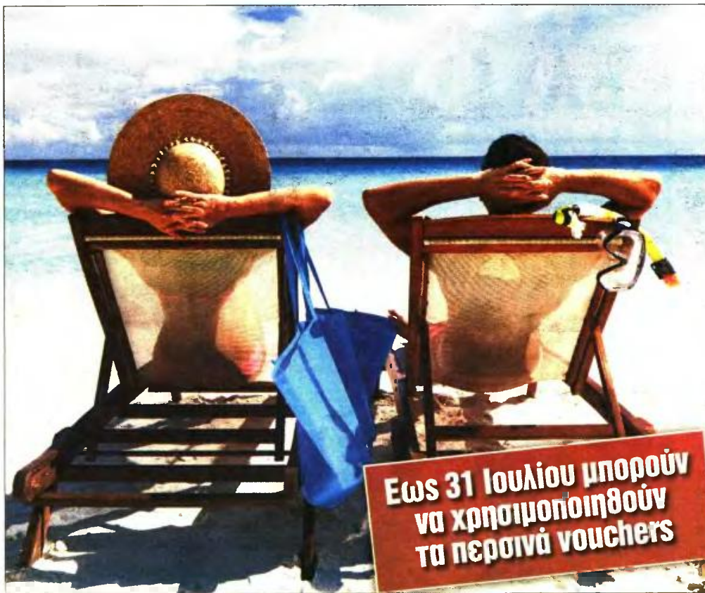
Οι αλλαγές που προωθούνται θα εστιάζουν στην αύξηση του ποσού της επιδότησης ειδικά για τον Αύγουστο

Το πρόγραμμα θα περιλαμβάνει 6 διανυκτερεύσεις και ανώτατο ποσό συμμετοχής 11,5 ευρώ / άτομο ανά διανυκτέρευση, με πρωινό και ειδική πρόνοια επιδότησης των ακτοπλοϊκών εισιτηρίων για τους δικαιούχους του προγράμματος. Ο κάτοχος του voucher πληρώνει το 1/3 της τιμής, καθώς η συνολική έκπτωση φτάνει στο