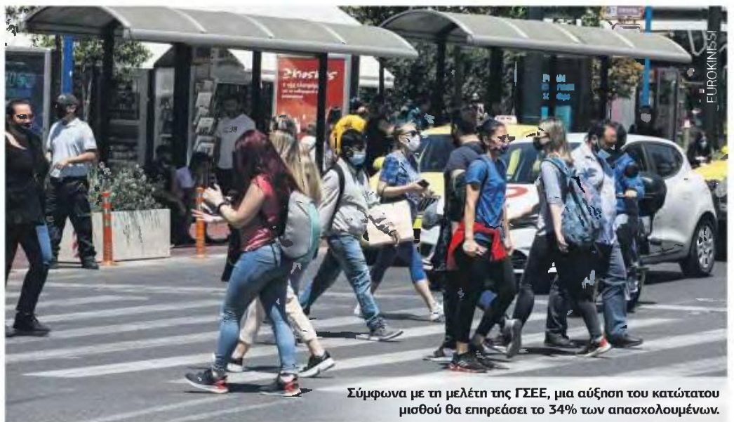
Σύμφωνα με τη μελέτη της ΓΣΕΕ, μια αύξηση του κατώτατου μισθού θα επηρεάσει το 34% των απασχολούμενων.