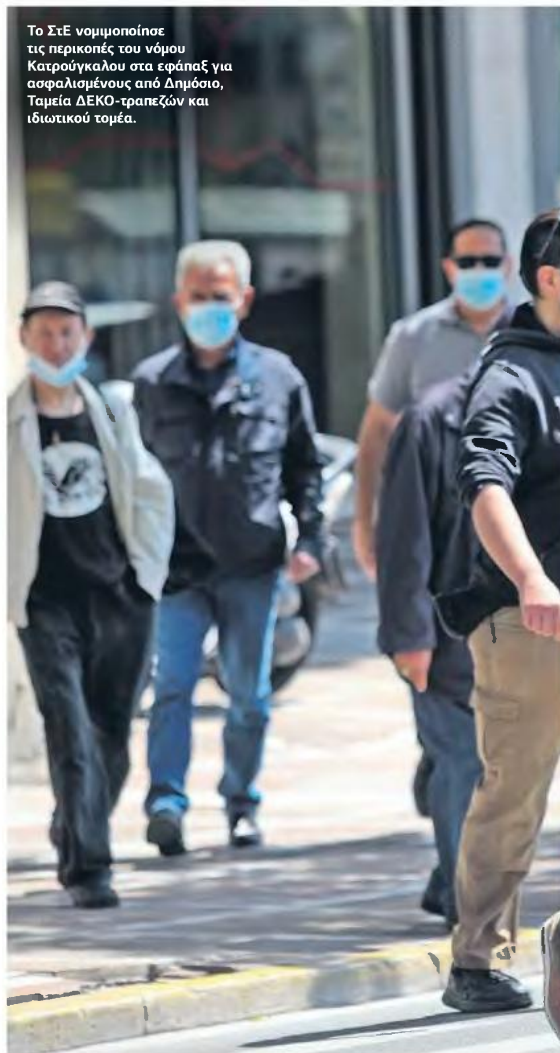
Το ΣτΕ νομιμοποίησε τις περικοπές του νόμου Κατρούγκαλου στα εφάπαξ για ασφαλισμένους από Δημόσιο, Ταμεία ΔΕΚΟ-τραπεζών και ιδιωτικού τομέα.

Το νέο στοιχείο, δε, είναι ότι οι ασφαλισμένοι απαγορεύεται να πάρουν πίσω τις εισφορές τους με το σκεπτικό ότι, όπως οι συντάξεις δεν μπορεί να είναι σε «καθορισμένο ύψος» όταν συντρέχουν δυσμενείς δημοσιονομικοί λόγοι, έτσι «και οι ασφαλιστικές εισφορές και οι ασφαλιστικές παροχές δεν είναι επιβεβλημένο ούτε από τη συνταγματική αρχή της ισότητας ούτε από τις γενικές αρχές του δικαίου της κοινωνικής ασφαλίσεως να καθορίζονται επί της ίδιας βάσης». ■