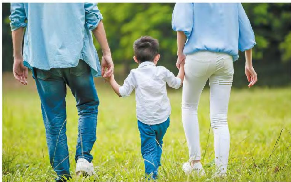
Το σχέδιο νόμου προτάσσει την ισότητα των γονέων, εισάγει τον θεσμό της διαμεσολάβησης, προβλέπει διευρυμένη επικοινωνία με τον γονέα που δεν ζει μαζί με το παιδί και προαναγγέλλει άμεση επιμόρφωση των δικαστικών λειτουργιών.

«Τα παιδιά χρειάζονται την παρουσία και των δύο γονέων στη ζωή τους», σχολιάζει ο κ. Γιώργος Νικολαΐδης, ψυχίατρος και διευθυντής Διεύθυνσης Ψυχικής Υγείας και Κοινωνικής Πρόνοιας Ινστιτούτου Υγείας του Παιδιού, «ωστόσο οι προτεινόμενες λύσεις είναι τεχνικές φύσης, τη στιγμή που απαιτείται εξατομικωμένη προσέγγιση». Το μοντέλο της εναλλασσόμενης κατοικίας είναι δύσκολο υλοποιήσιμο. «Δεν είναι αυτόνομο ότι μετά το διαζύγιο και οι δύο γονείς έχουν την οικονομική δυνατότητα για ένα μεγάλο σπίτι με παιδικό δωμάτιο ούτε ότι θα συνεχίσουν να μένουν σε κοντινές περιοχές». Ο ίδιος αντιπροτείνει τη θέσπιση οικογενειακών δικαστηρίων και υποστηρικτικών υπηρεσιών, «που θα μπορούσαν να βοηθήσουν το ζευγάρι που χωρίζεται, το οποίο εμφορείται από θυμό, παράνομο και ματαιώση».