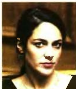
Η ΥΦΥΠΟΥΡΓΟΣ ΕΡΓΑΣΙΑΣ ΚΑΙ ΚΟΙΝΩΝΙΚΩΝ ΥΠΟΘΕΣΕΩΝ κ. ΔΟΜΝΑ ΜΙΧΑΗΛΙΔΟΥ.

Ως θεμελιώδες μέτρο στη διαμόρφωση μίας σύγχρονης δημογραφικής πολιτικής, χαρακτήρισε η υφυπουργός Εργασίας και Κοινωνικών Υποθέσεων, Δόμνα Μιχαηλίδου το επίδομα γέννησης. Έχοντας συμπληρωθεί ένας χρόνος από τη θέσπιση του επιδόματος των 2.000 (έχει αποδοθεί ήδη σε 78.500 νεογέννητα), η υφυπουργός τόνισε: «Αποτελεί σε συμβολικό αλλά και σε ουσιαστικό επίπεδο την προμετωπίδα της πολιτικής μας, με στόχο την αντιστροφή της αρνητικής δημογραφικής τάσης στη χώρα μας. Όλους αυτούς τους μήνες αποδείξαμε με πράξεις ότι η παιδική προστασία και η οικογένεια είναι απόλυτη προτεραιότητά μας».