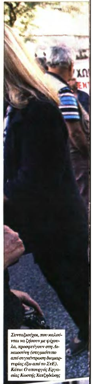
Συνταξιούχοι, που καλούνται να ζήσουν με ψίχουλα, προσφεύγουν στη Δικαιοσύνη (στιγμιότυπο από συγκέντρωση διαμαρτυρίας έξω από το ΣτΕ). Κάτω: Ο υπουργός Εργασίας Κωστής Χατζηδάκης

Όπως αποκαλύπτει σήμερα η «κυριακάτικη δημοκρατία» σε συνεργασία με το Ενιαίο Δίκτυο Συνταξιούχων, η μη ορθή εφαρμογή του νό-