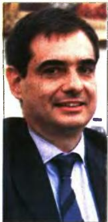
Ο διοικητής του ΕΦΚΑ Χρήστος Χάλαρης

τος, ώστε να εφαρμοστεί ο νόμος για τα νέα αυξημένα ποσοστά αναπλήρωσης για όσους έχουν άνω των 30 ετών ασφάλισης (4670/2020), θα έχει ως αποτέλεσμα να προκύψουν ποσά συντάξεων που δεν θα έχουν καμία σχέση με την πραγματικότητα.