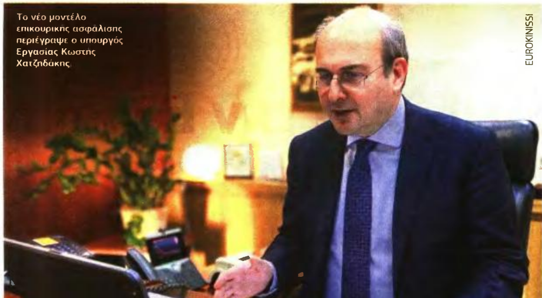
Το νέο μοντέλο επικουρικής ασφάλισης περιέγραψε ο υπουργός Εργασίας Κωστής Χατζηδάκης

ασφαλιστικό μας σύστημα, αναφέρθηκε ο κ. Σταϊκούρας, κάνοντας παράλληλα λόγο για αντικίνητρα αποταμίευσης και επενδύσεων στο ασφαλιστικό, αλλά και για έλλειψη κινήτρων ασφάλισης που