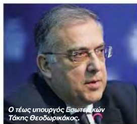
Ο τέως υπουργός Εσωτερικών Τάκης Θεοδωρικάκος.

χωρίς αντίστοιχη αύξηση του αριθμού των μελών του, και ενίσχυση των δομών του.