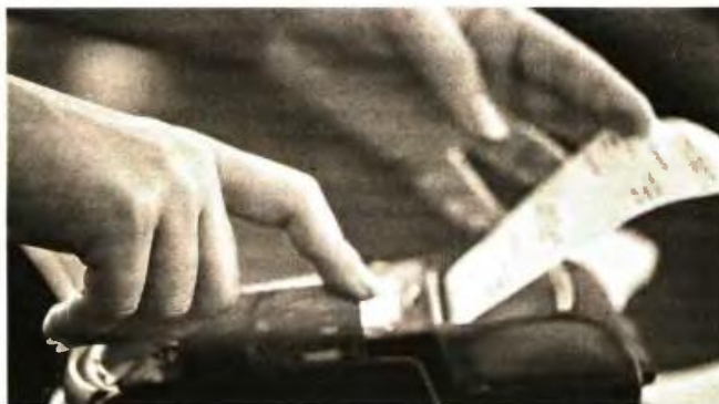
Στο τραπέζι του οικονομικού επιτελείου είναι ακόμα και το σενάριο να μη μετρήσουν καθόλου οι μήνες του lockdown για το μέτρο των ηλεκτρονικών αποδείξεων

ΕΝΦΙΑ: Στο υπουργείο Οικονομικών «τρέχει» η άσκηση της αναπροσαρμογής των αντικειμενικών αξιών των ακινήτων και της επέκτασης του συστήματος σε 3.000 περιοχές. Με την ένταξη στο αντικειμενικό σύστημα νέων περιοχών αναμένεται να δημιουργηθεί δημοσιονομικός χώρος ο οποίος, όπως ανέφερε χθες ο Σκυλακάκης, μπορεί να χρησιμοποιηθεί για τη μείωση των συντελεστών του ΕΝΦΙΑ προκειμένου να αποφευχθούν μεγάλες φορολογικές επιβαρύνσεις. Οι τελικές αποφάσεις θα ληφθούν τον Μάιο.