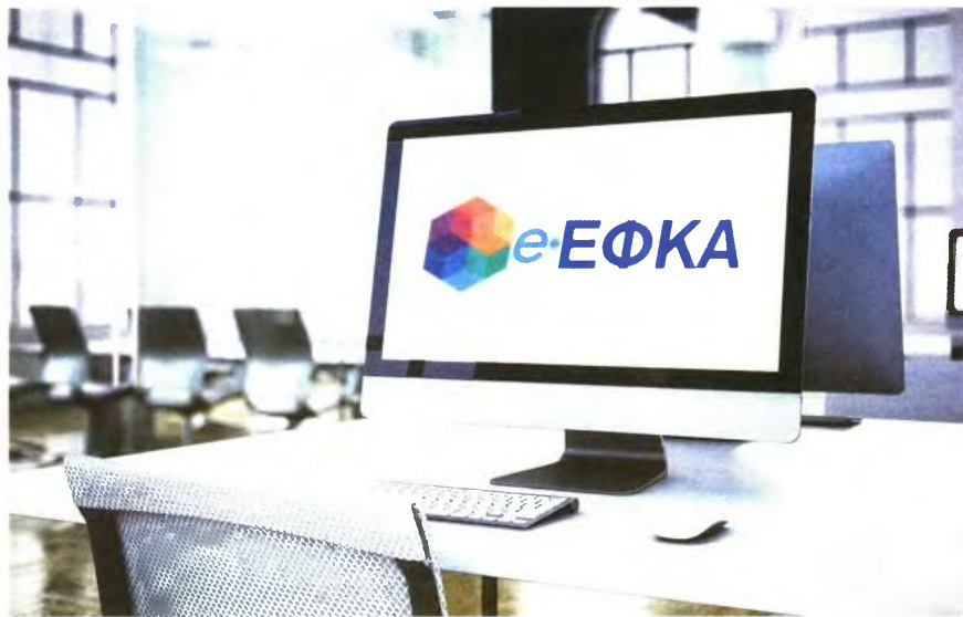
Εως τέλη Ιανουαρίου αναμένεται η καταβολή της 2ης δόσης των επιστροφών εισφορών σε όσους επαγγελματίες είχαν πιστωτικό υπόλοιπο από την εκκαθάριση του 2019.

ΑΠΟ ΤΟΝ ΔΗΜΗΤΡΗ ΚΑΤΣΑΓΑΝΗ katsaganis@kefalaiο.gr