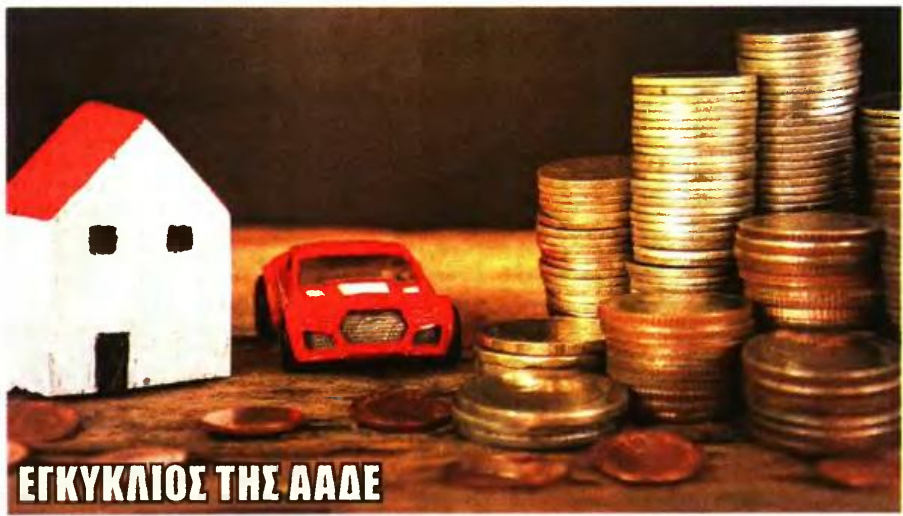
ΕΓΚΥΚΛΙΟΣ ΤΗΣ ΑΑΔΕ