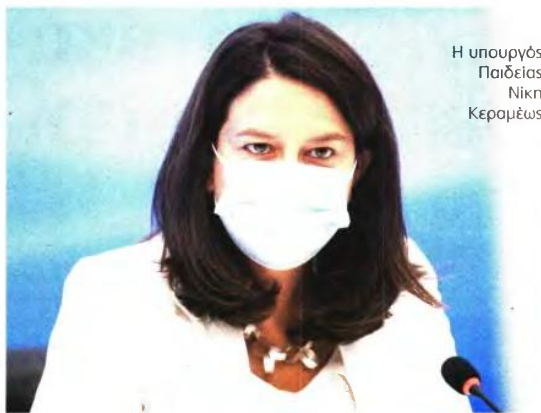
Η υπουργός Παιδείας Νίκη Κεραμέως