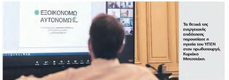
Τα θετικά της ενεργειακής επίδοσης παρουσίασε η ηγεία του ΥΠΕΝ στον πρωθυπουργό, Κυριάκο Μητσοτάκη.

θα πρέπει να αναγράφεται ορθά ο αριθμός παροχής ηλεκτρικής ενέργειας.