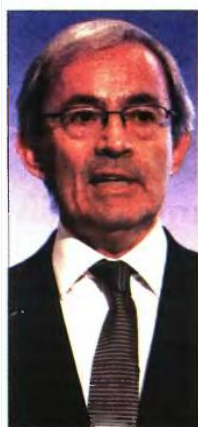
Ο νομπελίστας καθηγητής Χριστόφορος Πισσαρίδης