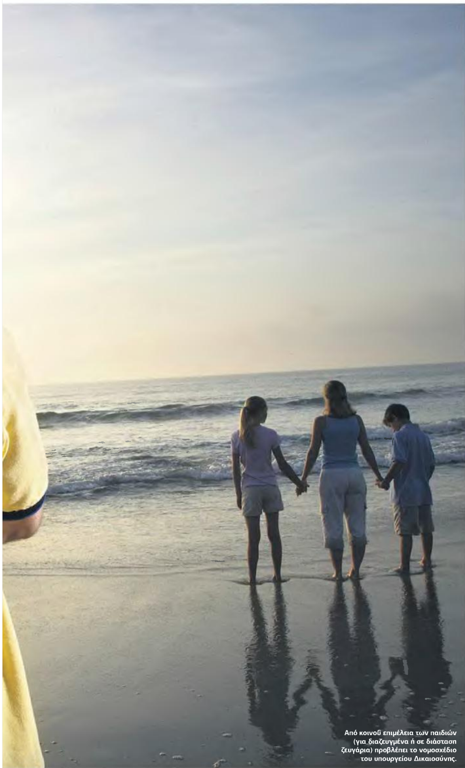
Από κοινού επιμέλεια των παιδιών (για διαζευγμένα ή σε διάσταση ζευγάρια) προβλέπει το νομοσχέδιο του υπουργείου Δικαιοσύνης.