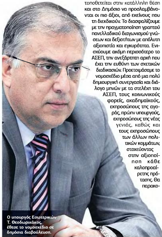
Ο υπουργός Εσωτερικών Τ. Θεοδωρικάκος, έθεσε το νομοσχέδιο σε δημόσια διαβούλευση.

ενδεκτικώς, αντικείμενο ρυθμό το γνω τις επι άλλες, λοιπά γ ας. Για συνέντι μόνο γ οποιών της αν αίτημα