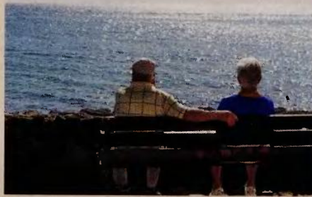
Όταν άρχισε να γίνεται αντιληπτή η έκταση του φαινομένου της δημογραφικής γήρανσης, σε όλες σχεδόν τις ανεπτυγμένες χώρες προωθήθηκε η συμπληρωματική κεφαλαιοποιητική επαγγελματική ασφάλιση.

τος θα επενδυθούν στην ελληνική οικονομία, δίνοντας ώθηση στον ρυθμό οικονομικής ανάπτυξης της χώρας. Αυτό μεταφράζεται σε υψηλότερη απασχόληση, υψηλότερη παραγωγικότητα και υψηλότερους μισθούς. Ως αποτέλεσμα, θα υπάρξουν υψηλότερα φορολογικά έσοδα και υψηλότερες εισφορές κοινωνικής ασφάλισης. Γι' αυτόν τον λόγο, παράλληλα με την αναλογιστική μελέτη, έχουμε αναθέσει και την εκπόνηση μακροοικονομικής