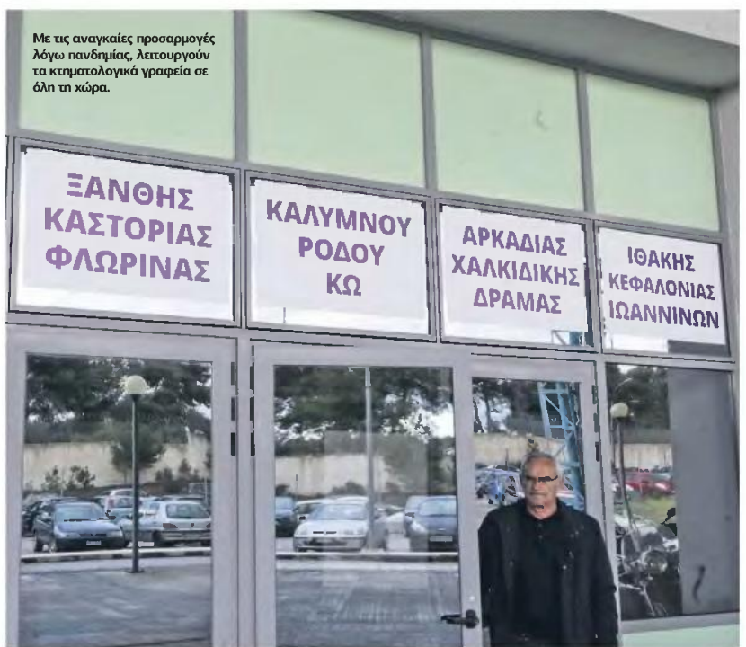
Με τις αναγκαίες προσαρμογές λόγω πανδημίας, λειτουργούν τα κτηματολογικά γραφεία σε όλη τη χώρα.

Για το χρονικό διάστημα που ισχύουν τα περιοριστικά μέτρα για τον κορονοϊό, δεν θα υπάρχει καμία επίπτωση στην εξέλιξη των υποθέσεων των πολιτών στα γραφεία κτηματο-