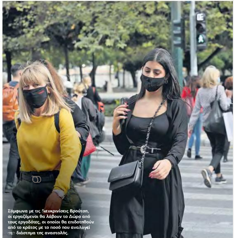
Σύμφωνα με τις ημεκρινίσεις Βρούτση, οι εργαζόμενοι θα λάβουν το Δώρο από τους εργοδότες, οι οποίοι θα επιδοτηθούν από το κράτος με το ποσό που αναλογεί για το διάστημα της αναστολής.