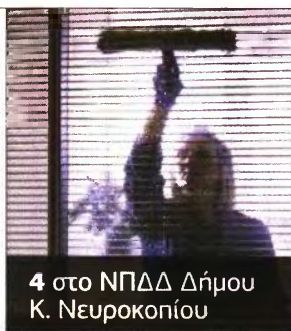
4 στο ΝΠΔΔ Δήμου Κ. Νευροκοπίου

Αποδεδειγμένη γνώση χειρισμού Η/Υ στα αντικείμενα: α) επεξεργασίας κειμένων, β) υπολογιστικών φύλλων και γ) υπηρεσιών Διαδικτύου. Αποδεδειγμένη εμπειρία (τουλάχιστον 6μηνη) συναφή με το αντικείμενο της προκηρυσσόμενης θέσης (αφορά το 60% των προκηρυσσόμενων θέσεων. Ανάμεσα στα δικαιολογητικά που θα πρέπει να καταθέσουν οι υποψήφιοι για τις εποχικές θέσεις περιλαμβάνονται η αίτηση, πιστοποιητικό οικογενειακής κατάστασης, αντίγραφο τίτλου σπουδών και φωτοτυπία των δύο όψεων της αστυνομικής ταυτότητας.