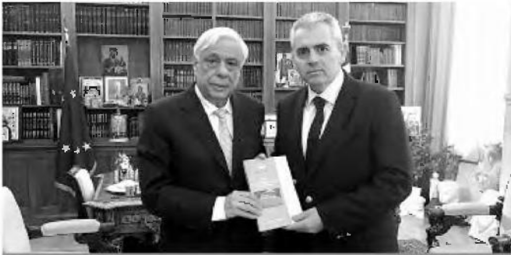
Ο Μ. Χαρακόπουλος επιδίδει στον τότε Πρόεδρο της Δημοκρατίας Πρ. Παυλιόπουλο την Έκθεση της Διακομματικής Επιτροπής της Βουλής για το Δημογραφικό (Φωτ. αρχείου)