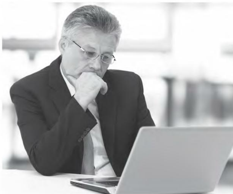
Αναδρομικά συντάξεων για κληρονόμους συνταξιούχων (συνταξιούχοι λόγω θανάτου)

Οι συνταξιούχοι του NAT: Αναδρομικά από σύνταξη θανόντος παίρνουν με αίτηση 14.137 δικαιούχοι. Το μέγιστο ποσό φτάνει στα 6.054 ευρώ και το μέσο στα 1.153 ευρώ. ■