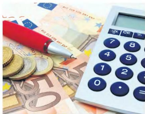
ΠΟΣΑ ΑΝΑΔΡΟΜΙΚΩΝ ΚΑΘΑΡΑ ΜΕΤΑ ΤΗΝ ΚΡΑΤΗΣΗ ΑΣΘΕΝΕΙΑΣ