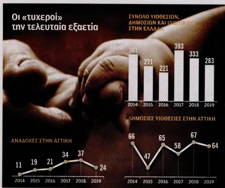
ΠΗΓΕΣ: Κέντρο Κοινωνικής Πρόνοιας Περιφέρειας Αττικής και ΕΛΣΤΑΤ

«Η μεταρρύθμιση ενοχλεί» Πολλοί απ' όσους εργάζονται στον χώρο θεωρούν ότι η μεταρρύθμιση «ενοχλεί», καθώς ανατρέπει έναν καθιερωμένο τρόπο δουλειάς. «Υπάρχει υποστελέχωση, π.κ. ολόκληρες περιφερειακές ενότητες δεν έχουν καθόλου κοινωνικό λειτουργό, πολλοί δημόσιοι υπάλληλοι δεν έχουν εξοκείωση με τις νέες τεχνολογίες ή δεν γνωρίζουν το αντικείμενο, ενώ πολλά ιδρύματα θέλουν να διατηρήσουν τον μεγάλο αριθμό των τροφιμών τους – για ευνόητους λόγους», σημειώνει στην «Κ» κοινωνικός λει-