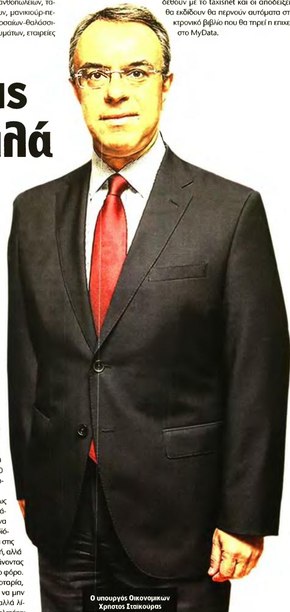
Ο υπουργός Οικονομικών Χρήστος Σταϊκούρας

Τροποποιήσεις θα υπάρξουν και στη φορολογία, ώστε να γίνει πιο ελκυστική για τους πολίτες και να μην κερδίζουν πολλοί λίγα, όπως ισχύει σήμερα, αλλά λιγότερα περισσότερα. Σύμφωνα με πληροφορίες, μελετάται