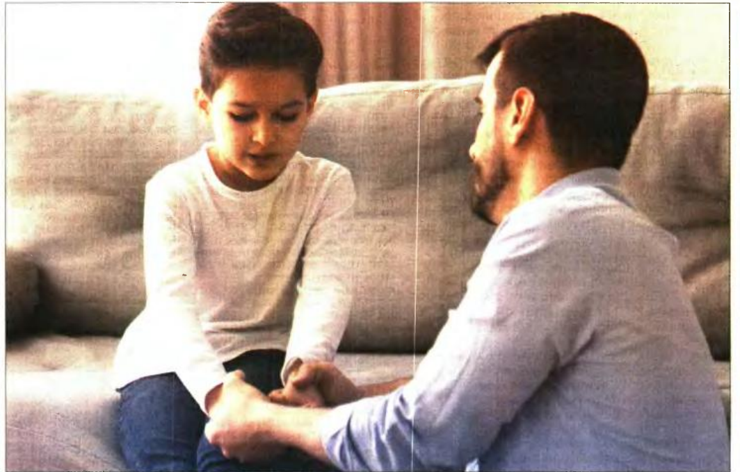
Το βασικό για τον διαζευγμένο πατέρα είναι να αποδείξει ότι η επαφή και η επικοινωνία του με το τέκνο του ήταν και είναι όσο το δυνατόν πιο συχνή

Αν το παιδί, που συνήθως χρειάζεται περισσότερο τη μητέρα του από τον πατέρα του σε μια τόσο μικρή ηλικία, μένει με τη μητέρα του αλλά αποζητά έντονα και την παρουσία του πατέρα του, τότε με την αίτηση επικοινωνίας ο γονιός θα πρέπει να διεκδικεί περισσότερες μέρες και ώρες από το σύνθηδες και τυπικά, ώστε να γίνει κατανοητό από το δικαστήριο ότι υπάρχει ο πατέ-